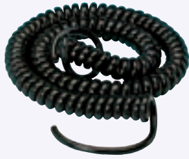
ECVCTF 0.75mm 2 3芯 1m